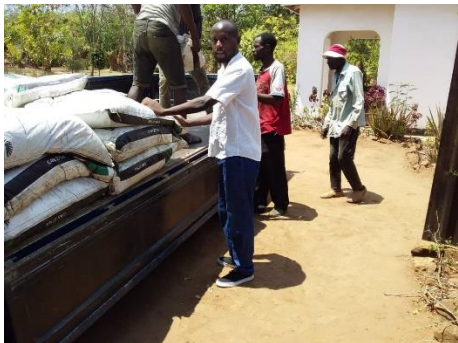
De kunstmest wordt verdeeld